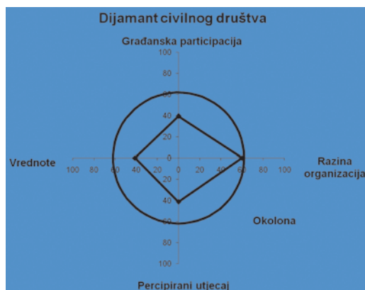
Grafikon 1. ICD 2008.-2010. dijamant civilnog društva u Hrvatskoj

Navedene dimenzije vizualno su prikazane kao dijamant civilnog društva (vidi grafikon 1.). Dijamant civilnog društva oblikovan je temeljem 67 kvantitativnih indikatora, agregiranih u 28 poddimenzija, iz kojih su u konačnici izračunate vrijednosti 5 dimenzija, na skali od 0 do 100. Veličina dijamanta portretira empirijski dobivenu sliku stanja civilnog društva, uvjeta koji podupiru ili kočje razvoj civilnog društva, kao i učinke aktivnosti civilnog društva u društvu u cjelini. Dimenzija okoline vizualno je prezentirana kao kružnica s ishodištem u sjecištu osi dijamanta, i iako se ne smatra sastavnim dijelom samog civilnog društva, okolina čini krucijalan element njegovog razvoja.